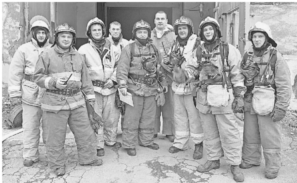
ПОСЛЕ УЧЕНИЙ. Личный состав СПСЧ-4.