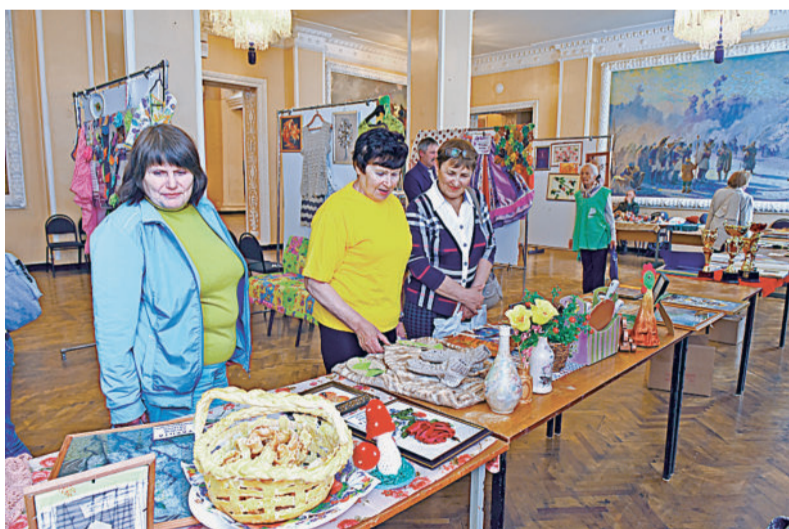
НАШИ РУКИ НЕ ДЛЯ СКУКИ! В фойе Дворца Победы развернулась выставка поделок златоустовских ветеранов.