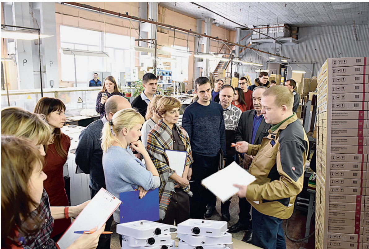
ПЕРЕХОДИМ К ПРАКТИКЕ. Участники группы находят пути модернизации производства.