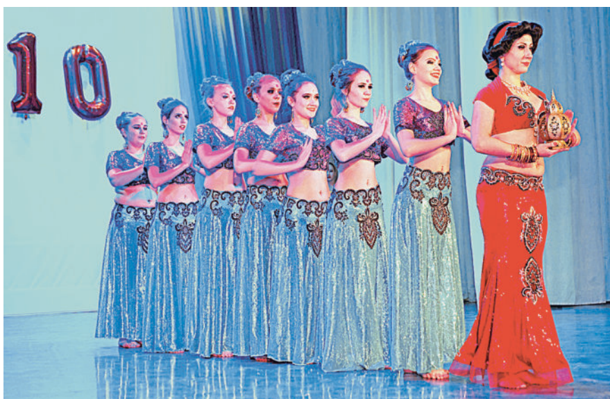
СКАЗКА ВОСТОЧНОГО ТАНЦА. На сцене «Жасмин».

Группа профилактики пожаров СПСЧ-4 и отделение ФГПН СУ ФПС № 29.