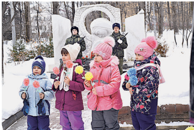
ПАМЯТИ ПАВШИХ БУДЬТЕ ДОСТОЙНЫ!

Наши ветераны — неизменные участники всех городских и заводских мероприятий патриотической направленности. Так, 3 декабря, в День Неизвестного Солдата, у обелиска Славы состоялся митинг, участниками которого стали кадеты, школьники и студенты горо-