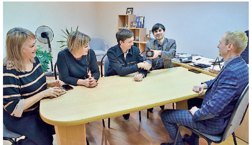
Поделились впечатлениями с коллегами из кадровой службы