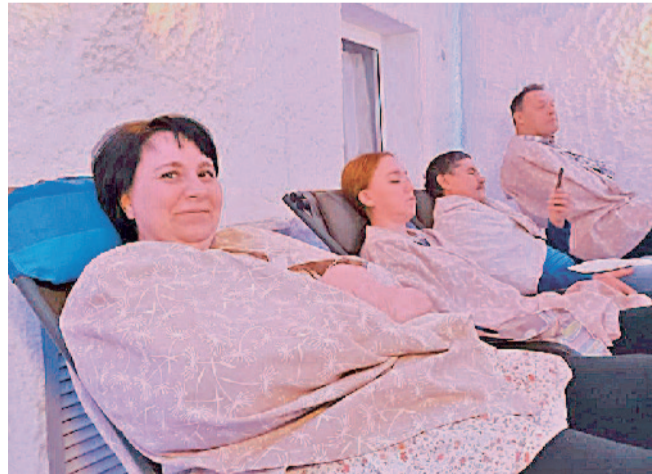
Каждый вечер завершается в соляной шахте