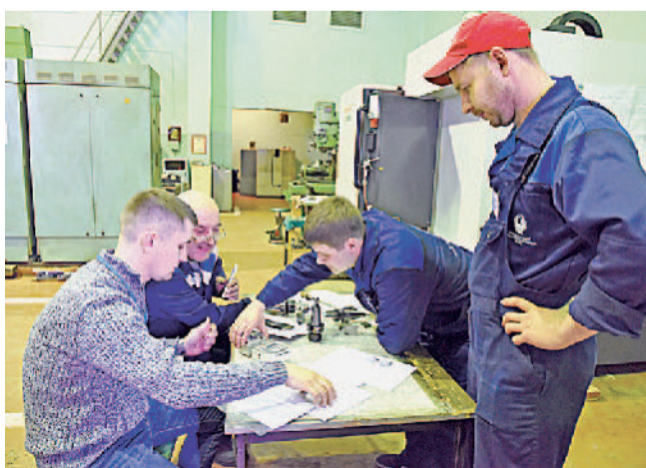
На Златоустовском машиностроительном заводе прошёл чемпионат «Профессионалы Златмаш-2019» по компетенциям «Фрезерные работы на станках с ПУ» и «Электротехника».