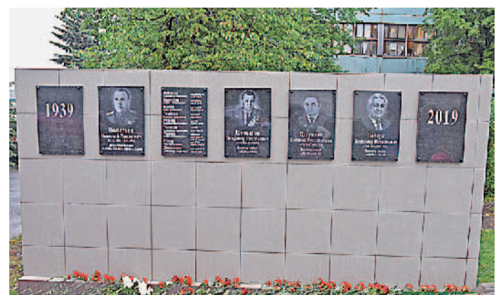
28 июня 2019 года, в День рождения Златоустовского машиностроительного завода, состоялось открытие мемориала Памяти директора, возглавлявшим наше предприятие в разные годы.