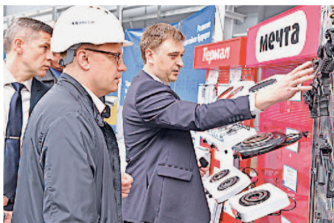
Губернатор Челябинской области Алексей Текслер с рабочим визитом посетил Златоустовский машиностроительный завод.

Лично я не могу нарадоваться, когда вижу положительные