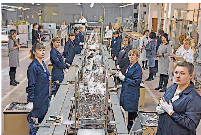
В ноябре плиточное производство отметило своё 50-летие.