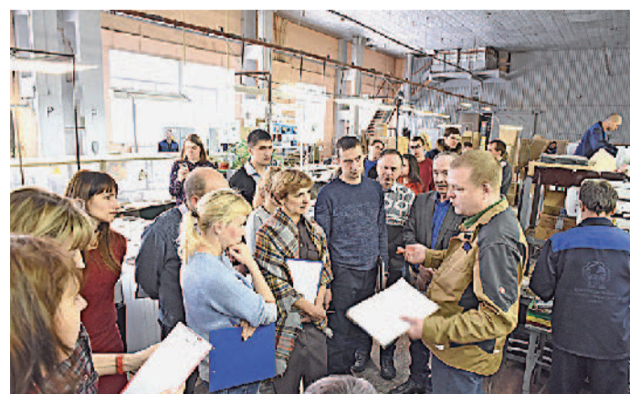
Златоустовский машиностроительный завод вошёл в число российских предприятий, на которых стартовал Национальный проект «Производительность труда и поддержка занятости».