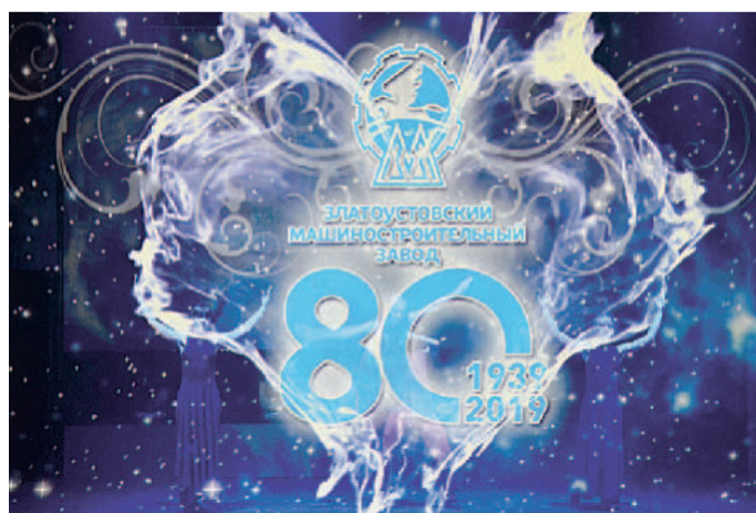
28 июня 2019 года трижды орденоносный Златоустовский машиностроительный завод отметил своё 80-летие.