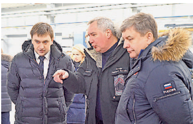
Делегация Государственной корпорации «Роскосмос» во главе с генеральным директором Дмитрием Рогозиным с рабочим визитом посетила Златоустовский машиностроительный завод.

❄️ Люди ❄️ События ❄️ Факты ❄️ 2019 ❄️ Люди ❄️ События ❄️ Факты ❄️ 2019 ❄️ Люди ❄️ События ❄️ Факты ❄️ 2019 ❄️