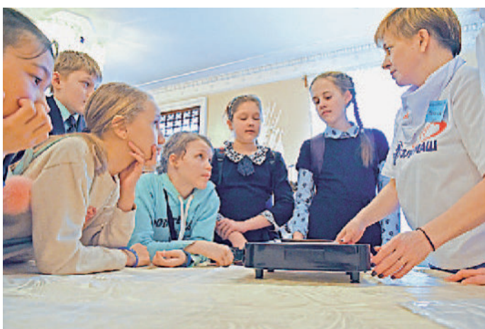
На Златмаше прошёл IV профориентационный проект «Мы — будущие машиностроители!»

* Люди * События * Факты * 2019 * Люди * События * Факты * 2019 * Люди * События * Факты * 2019 *