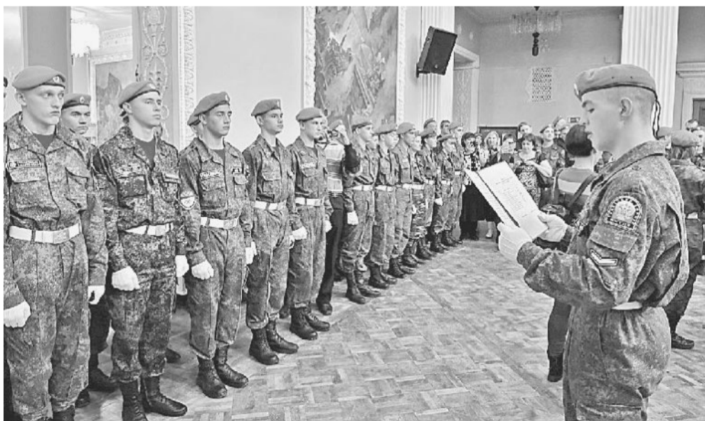
ПЕРЕД ЛИЦОМ ТОВАРИЩЕЙ. 36 новобранцев присягнули на верность Родине.