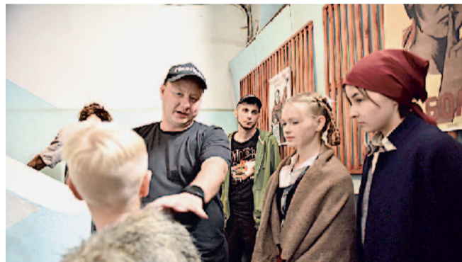
Взгляд режиссера. В процессе съемки