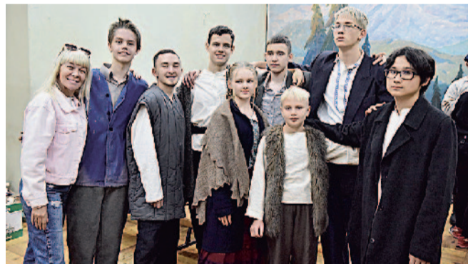
Назад в прошлое. С дебютом, «Велена»!