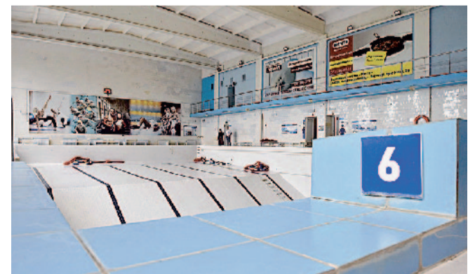
Скоро чаша бассейна наполнится чистой водой, а сам ФОЦ — новыми посетителями