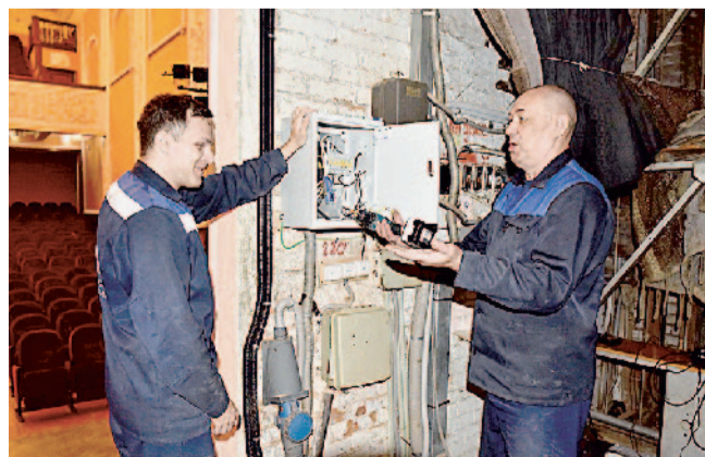
Электропроводку заменили полностью

Творческий сезон и правда обещает быть насыщенным: обновленный репертуар, традиционные праздничные мероприятия, гастрольные выступления, включение Дворца Победы и музея АО «Златмаш»