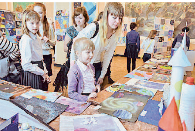
55 лет назад советский космонавт Юрий Гагарин облетел нашу планету на корабле «Восток». Эту юбилейную дату златоустовские машиностроители праздновали особенно торжественно.