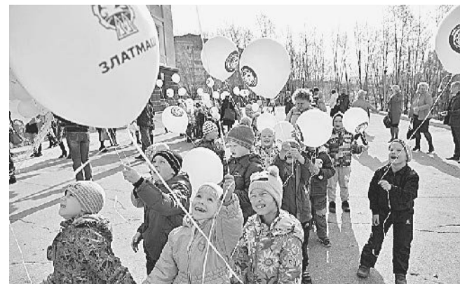
28 сентября прошло масштабное мероприятие в рамках профориентационного проекта «Мы — будущие машиностроители» для воспитанников дошкольных образовательных учреждений, школьников и студентов.