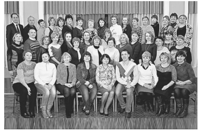
Первичной профсоюзной организации АО «Златмаш» исполнилось 75 лет.