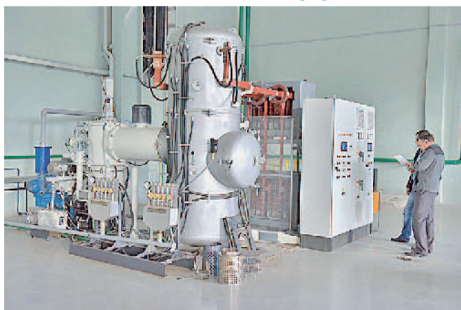
Масштабная реконструкция и модернизация производственного корпуса, где установлено новое оборудование, позволяющее проводить практически все виды термобработки.