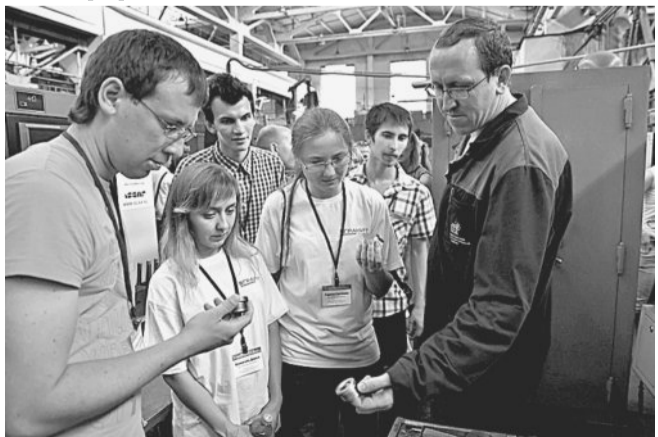
АО «Златмаш» стало площадкой проведения пятого Форума молодёжи Уральского федерального округа Профобщемаша России «Профсоюз — это мы!».

ЛЮДИ ❄ СОБЫТИЯ ❄ ФАКТЫ ❄ 2016 ❄ ЛЮДИ ❄ СОБЫТИЯ ❄ ФАКТЫ ❄ 2016 ❄