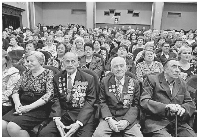
Ветеранской организации завода исполнилось 50 лет.

ЛЮДИ ❄ СОБЫТИЯ ❄ ФАКТЫ ❄ 2016 ❄ ЛЮДИ ❄ СОБЫТИЯ ❄ ФАКТЫ ❄ 2016 ❄